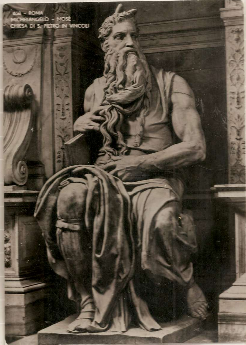
456 - ROMA MICHELANGELO - MOSE CHIESA DI S. PIETRO IN VINCOLI